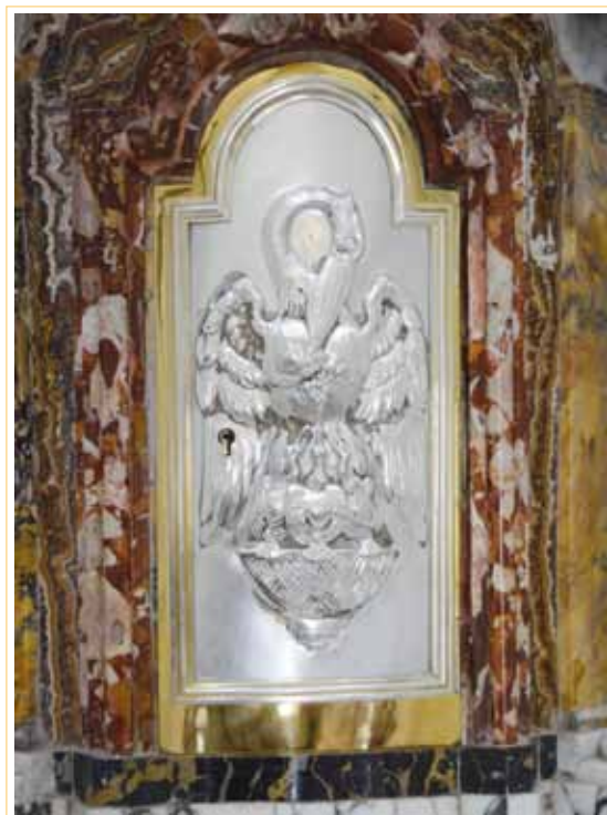
Fano, Eremo di Monte Giove: Tabernacolo della chiesa decorato con la figura del pellicano.