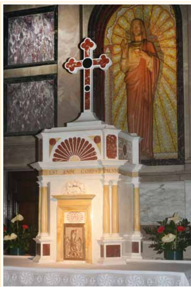
Fano. Tabernacolo della Basilica di S. Paterniano con i simboli del pellicano, dell'agnello immolato e del Sacro Cuore di Gesù, simboli dell'amore e della misericordia.

Da questa favoletta di Leonardo da Vinci il pellicano è divenuto il simbolo dell'abnegazione con cui si amano i figli. Per questa ragione l'iconografia cristiana ne ha fatto l'allegoria del supremo sacrificio di Cristo, salito sulla croce e trafitto al costato da cui sgorgarono il sangue e l'acqua, fonte di vita per gli uomini.