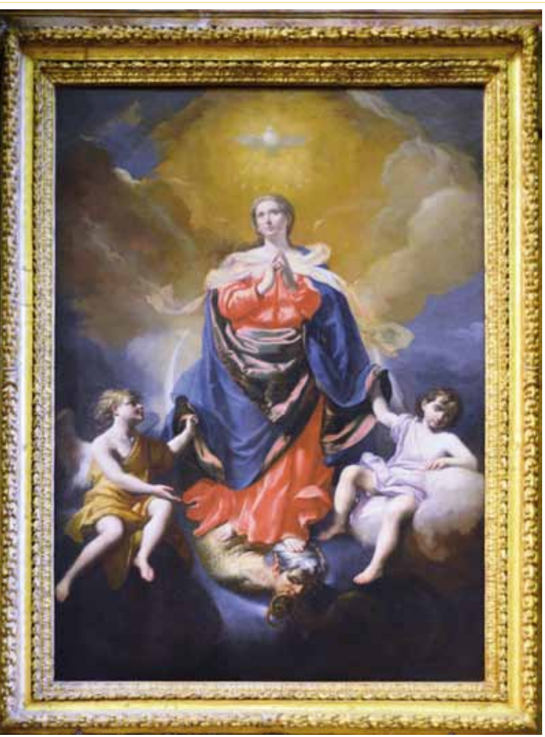
Gubbio. Chiesa di San Francesco. “Immacolata Concezione” di Antonio Gherardi (1638 – 1702). La Madonna con la sua umiltà schiaccia il “superbo Satana”.

“Cari fratelli e sorelle, ho pensato spesso a come la Chiesa possa rendere più evidente la sua missione di essere testimone della Misericordia. È un cammino che inizia con una conversione spirituale. Per questo ho deciso di indire un Giubileo straordinario che abbia al suo centro la misericordia di Dio.