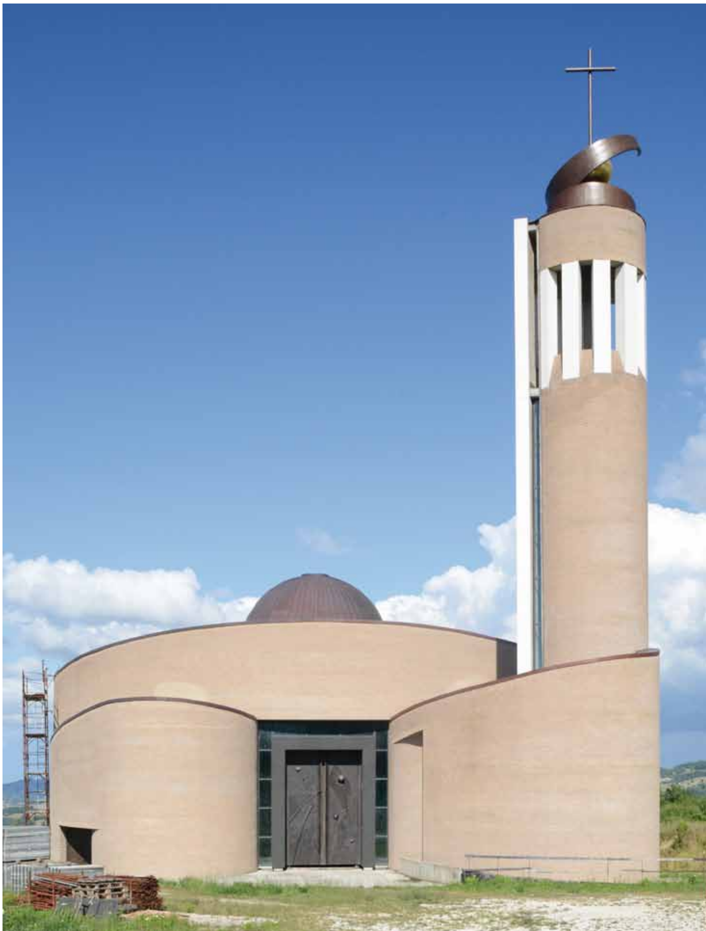
Urbino -Veduta del portale dell'erigendo Santuario del Sacro Cuore di Gesù.